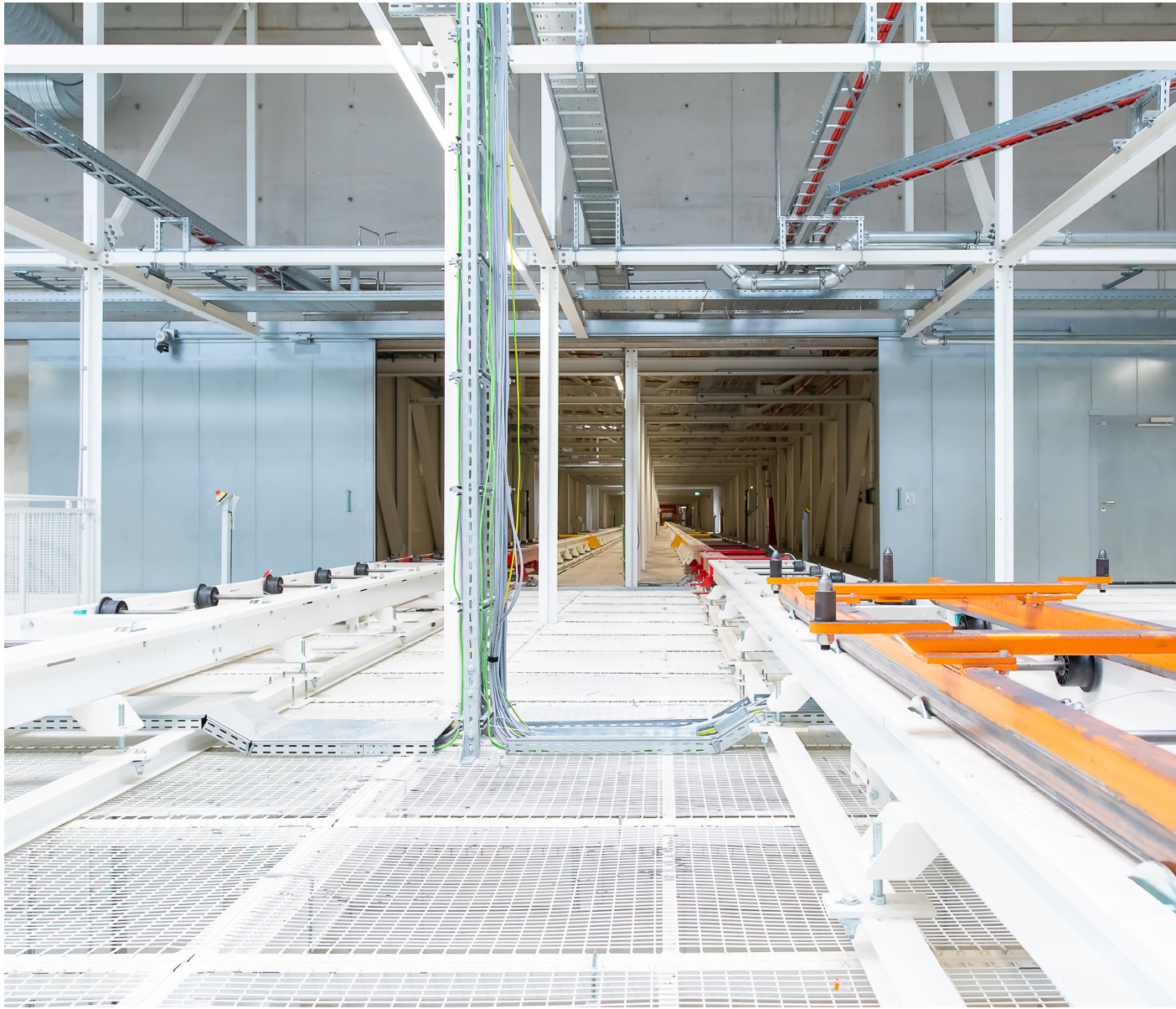
Volkswagen i Emden 2021